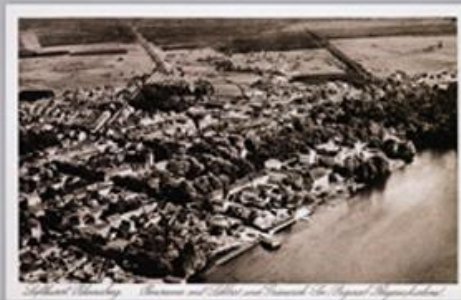
Das historische Bildarchiv besitzt viel Grün - ohne allenfalls in der Publikation abwärts geschleppt.