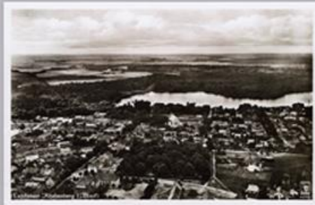
Die Entwicklung der Luftfahrt ermöglicht es auch, spektakuläre geringe Luftaufnahmen anzufertigen und so als Postkarte zu verwenden, diese die Sicht auf Rheinsberg aus der Vogelperspektive ermöglicht immer einen besonderen Blick. Im unteren Bildraum ist links die Schule, daneben die Schlossruine und darüber in der Mitte der bewaldete Friedhof und die Kirche zu sehen.