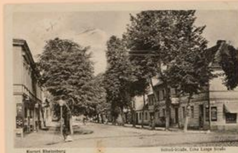
Langenscheidt war nie mehr die Schloßstraße. Interessant ist, dass die Räume auf der Straße stehen, also die Bausubstanz zwischen dem Gehweg und der Ruine verbleibt. Im Vordergrund eine Galanterie zur Belebung der Straße.